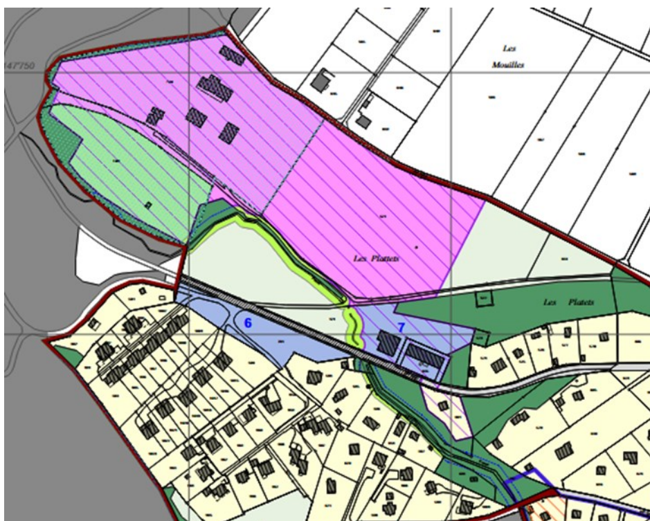
Plan de la zone (PACom – Nouveau)

La Municipalité propose d'installer ce dispositif sur la parcelle privée communale n° 121, qui est définie en zone d'utilité publique et dont l'affectation est conforme au projet.